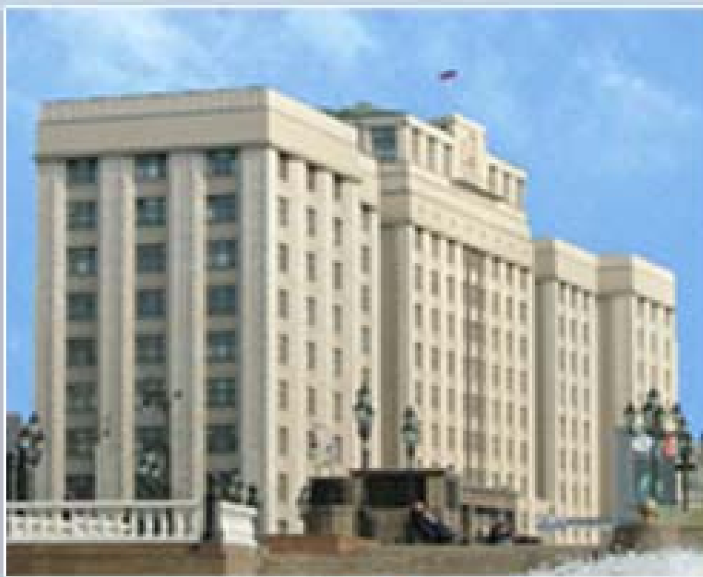
Официальная резиденция Государственной Думы с 1994 года г.Москва, ул.Охотный ряд, 1